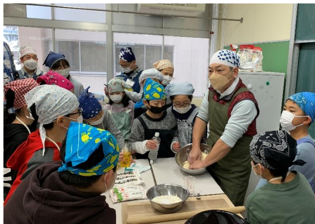
「エ～1000 回も、こねるんですか～」