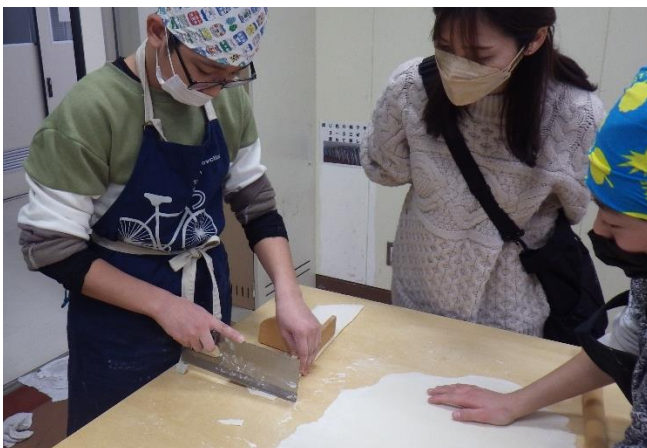
「同じ太さに切るのは難しいな～」