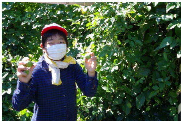
「1456 個、22Kgの実を収穫しました!」

5年生は総合的な学習の時間に阿賀町の花「雪椿」の学習をしています。秋に雪椿の実を収穫し、巴山組さんから協力をいただき、雪椿油を絞りました。その油を使って「雪椿うどん」作りに挑戦です。町役場の方から教えていただき、おいしい雪椿うどんができました。