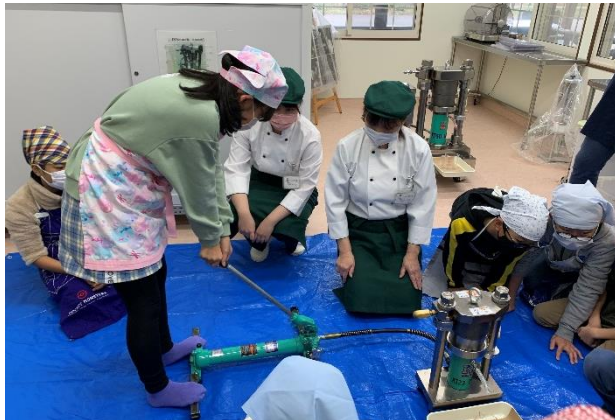
「重いよ～ 油絞りは大変だ～」