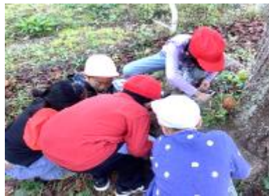
2年生 生活科 生きものと友だち 虫ハウス完成！ 阿賀町の美しい自然環境で学ぶ