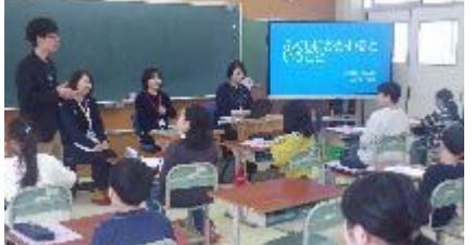
4年生 総合的な学習の時間 心のユニバーサルデザイン（福祉） 講師 阿賀町社会福祉協議会の皆様