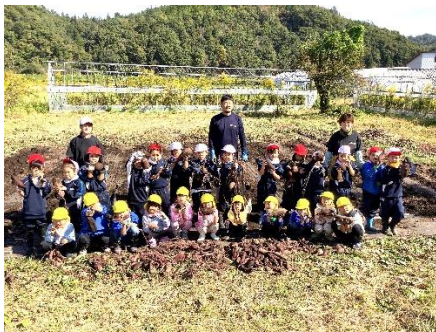
1年生 生活科 芋ほり交流会 ひまわり保育園年長児さんと活動 講師 わたなべ農園 様

保護者・地域の皆様には、徒歩通学の見守り、バス乗降場所までの送迎など、可能な範囲で安全確保のご協力を引き続きお願いいたします。学校でも警察や町関係機関と連携して見守りを続けます。