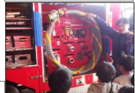
3年生 社会科 地域の安全を守る 消防署見学 講師 阿賀町消防本部の皆様