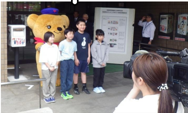
R8.4.22 郵便局ラッピングポストお披露目式典 4,5年