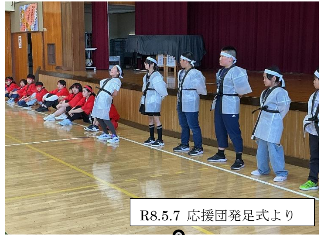
R8.5.7 応援団発足式より